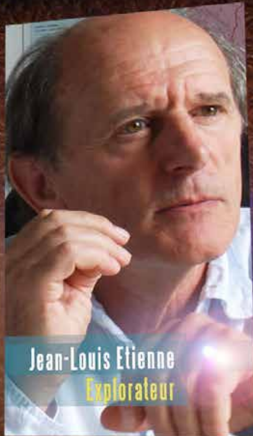
Jean-Louis Etienne Explorateur